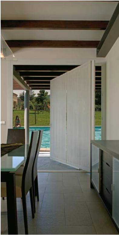
SOPRA , UNO SCORCIO DEL LIVING CHE AFFACCIA SULLESTERNO. SOTTO , IL BIOVILLAGGIO ALL'INTERNO DEL QUALE SI TROVA LA RESIDENZA.

componenti della famiglia sono alloggiate nel secondo corpo di cui l'edificio è composto. Il fascino dell'abitazione deriva in gran parte dal sapiente mix di materiali (legno, acciaio, pietra, vetro e vetrocemento). Ma le caratteristiche performanti sono consentite dalla tecnologia all'avanguardia degli impianti e dal sistema domotico che controlla la ventilazione, il riscaldamento radiante con centralina climatica.